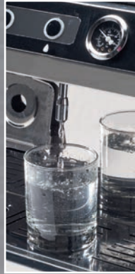
Beccuccio acqua calda Hot water dispenser nozzle