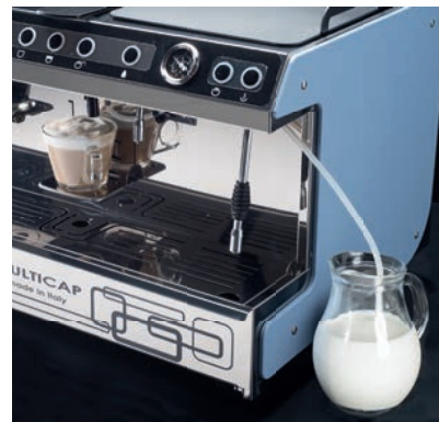
Funzione crema latte e cappuccino automatico Automatic cappuccino and crema latte function