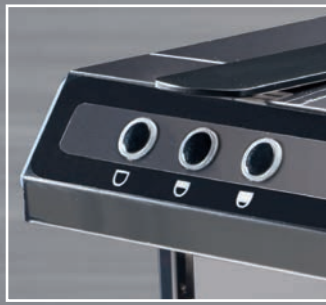
3 dosi caffè programmabili 3 programmable coffee doses