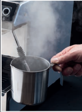
Beccuccio vapore Steam dispenser nozzle