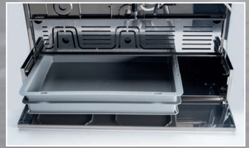
Vasca raccolta capsule estraibile Removable capsules collection tank