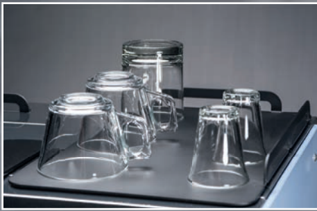
Porta tazze riscaldato Heated cups holder